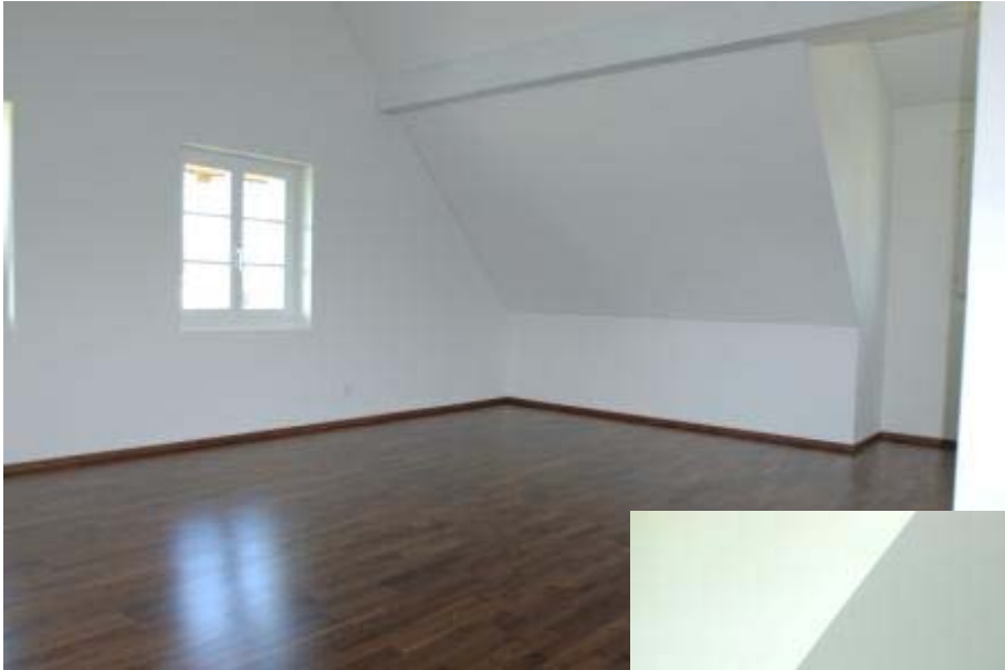
Schlafzimmer Mit direktem Zugang ins Bad