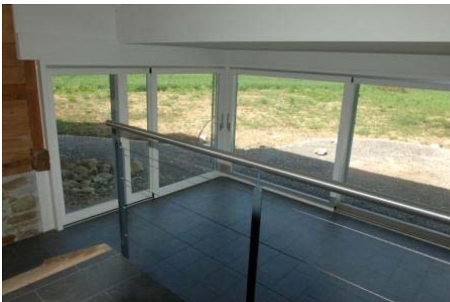
Wintergarten Ehem. Eingang (Laube)